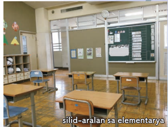
silid-aralan sa elementarya

Noong ako ay nasa nursery school, gusto kong ipagpatuloy ang paglalaro ng aking mga paboritong laruan, kaya hindi ko maitabi ang mga ito kahit na oras na para sa meeting sa umaga, at kung minsan ay nanggagalaito ako. Noong makapasok sa special support school, unti-unti kong natutupad ang aking mga pangako sa aking mga guro, Nagiging excited na ako sa aking mga paboritong laruan at aktibidad, at nakikilahok na din sa mga meeting sa umaga. Excited na din akong kumustahin, tawagin ang mga pangalan ng aking mga kaibigan, at makipaglaro sa aking mga guro.