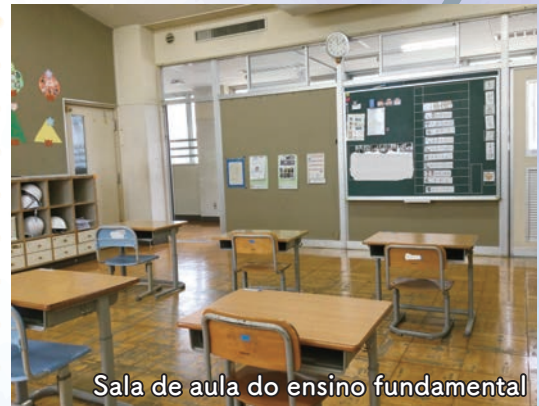
Sala de aula do ensino fundamental

Quando frequentava a creche, continuava brincando com seus brinquedos preferidos, não conseguia guardar seus brinquedos no momento do recolhimento matinal e, às vezes, era violento. Depois de ingressou na escola de apoio especial, ele foi incentivado a se envolver com os brinquedos e atividades favoritas e gradualmente, pudera participar das reuniões matinais pois chegou a tempo, para que pudesse cumprir com suas promessas com os professores. Fica ansioso para cumprimentar uns aos outros na reunião matinal, chamar os nomes dos amigos e brincar com os professores.